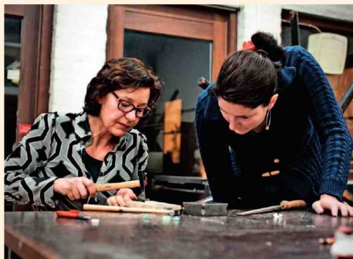
Les formations augmentent de 22% les chances de trouver un job.

L'offre de Bruxelles Formation couvre 80% des fonctions critiques identifiées dans la capitale.