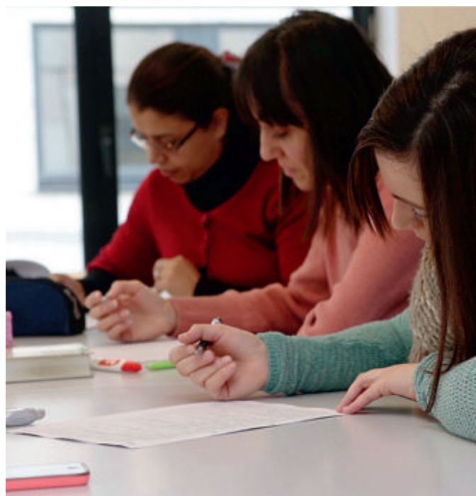
► Bruxelles Formation entend accueillir avec ses partenaires plus de 21 000 chercheurs d'emploi.

Enfin, le renforcement des formations à distance constitue un autre axe du plan 2019. Bruxelles Formation a lancé en