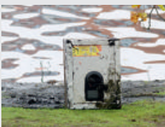
▶▶ L'un des coffres retrouvés.